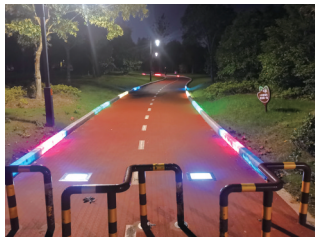
植物园灯光步道。

在南通植物园北大门门外，记者根据值班保安指点的具体位置，找到了薛先生所说的失灵的智能互动大屏和步道。