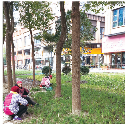
工人正在栽种麦冬草。记者张园

红色的石楠，碧绿的金桂，优雅的垂丝海棠，遒劲的罗汉松……在崇川区有关部门和港闸经济开发区管委会全力推动下，深南路保利香槟国际南门外长达百余米的“停车场”已经成为芳草萋萋的生态景观带。