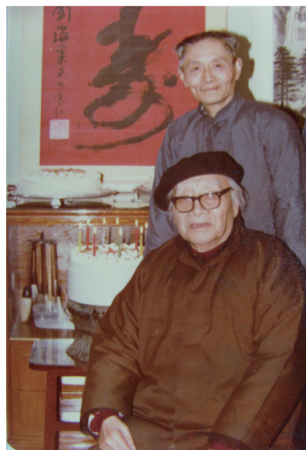
范韧庵与刘海粟(前)