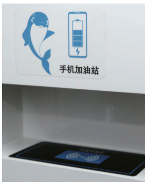
▲手机无线充电处。 ◀地铁换乘处。