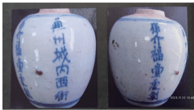
“通州城内西街，孙介福堂处制”老药罐（摄自《南通老商标》）。