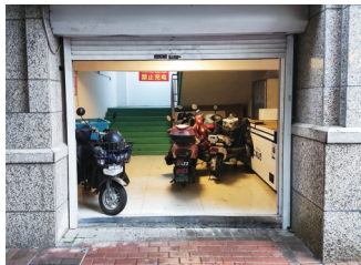
停满电动车的消防楼梯间。

实有关情况。记者看到涉事楼梯间的门已经解锁,消防通道处于开放状态,一楼楼梯间西侧和北侧墙壁上各张贴一条“消防通道 禁止充电”的警示标语。但楼梯间内停放着5辆电动自行车,其中2辆正在充电。