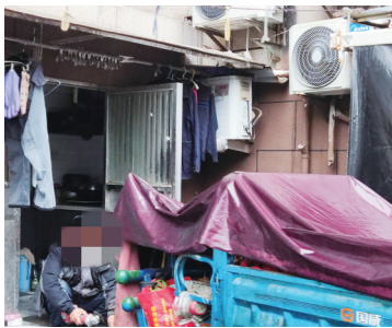
租户车库门口。记者张园

了解相关信息后,市12345政府热线在线平台工作人员立即将此事向崇川区政府予以通报,任港街道工作人员在调查后表示,社区网格员、派出所协