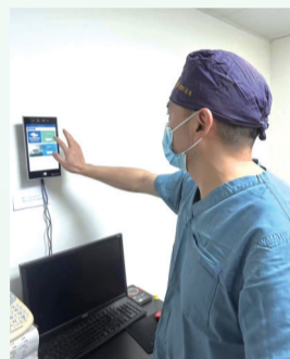
医生术前刷脸打卡。

38;当日预警5个,本周预警6个,本月预警6个……”1月2日,在崇川区卫生监督所内,工作人员正在实时查看医美在线监管平台的相关数据。记者看到,目前,崇川区正在营业的62家医美机构的具体位置以黄色标记清晰地展示在一张地图上。