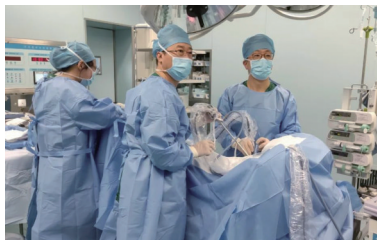
与上海市肺科医院全方位合作逾十年，微创胸腔镜年手术量超400例