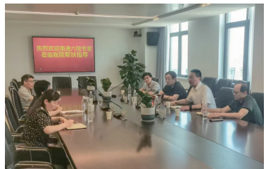
深化宿迁老年病医院帮扶合作