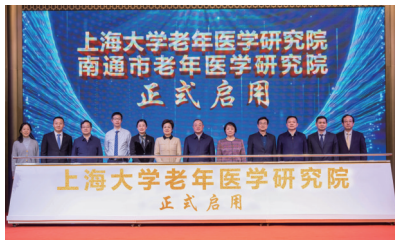
上海大学老年医学研究院（南通市老年医学研究院）启用