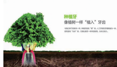
种植牙 像植树一样“植入”牙齿

据专家介绍,过去缺牙只能通过活动假牙来恢复牙齿功能和美观,但磨好牙、损害邻牙的问题比比皆是,给患者带来更大的困扰。随着口腔医学的进