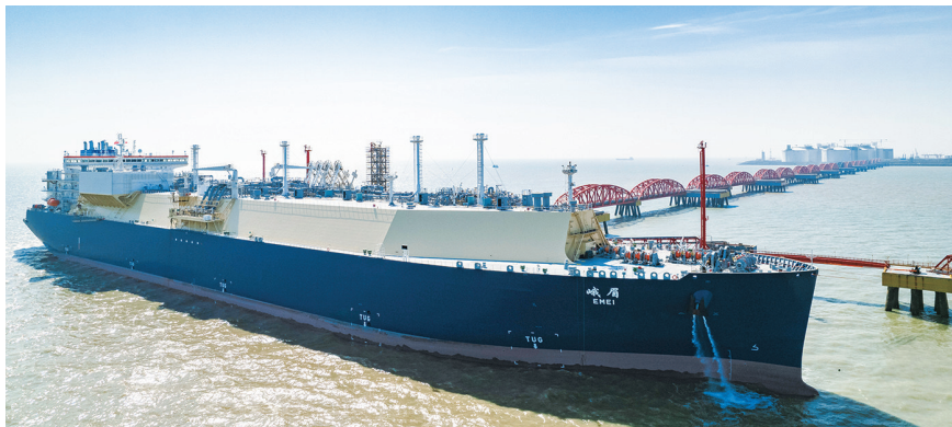
“峨眉”号停靠洋口港阳光岛。

晚报讯 19日下午,满载16万立方米LNG的“峨眉”号,回到如东洋口港阳光岛中石油江苏LNG码头。作为中国石油自有LNG运输船,“峨眉”号于去年年底正式“入列”冬供。此次跨洋载货而归,是该轮投运后首次回国卸货,标志着LNG产业领域又一“大国重器”顺利上岗,对于提升LNG运输能力、增强天然气保供能力、提高LNG贸易灵活性具有重要意义。