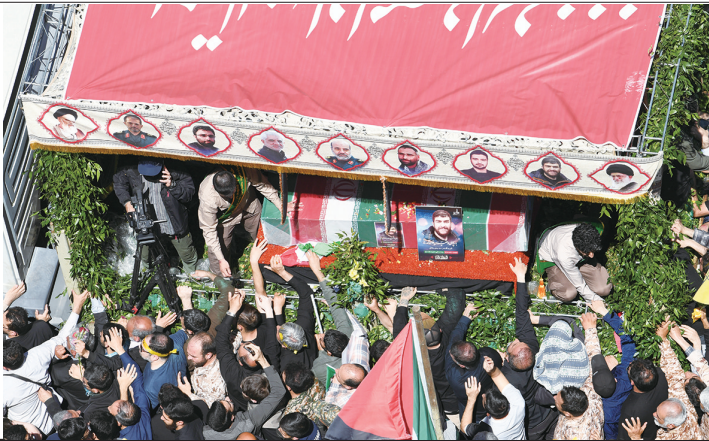
五日,在伊朗德黑兰,人们参加伊朗驻叙使馆遭袭事件中丧生的七名伊朗伊斯兰革命卫队成员的葬礼。

分析人士认为,鉴于直接攻击以色列或将导致中东战事显著升级,不符合伊方利益,后者更可能选择相对间接的回应手段。