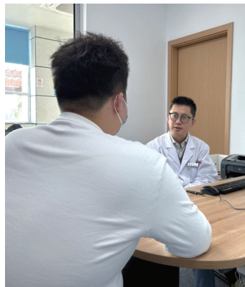
门诊中与患者交流。