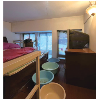
居民用面盆在家接水。