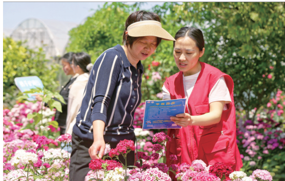
26日,海安市白甸镇网络文明志愿者通过发放宣传页、现场讲解等方式,引导群众自觉抵制网络谣言及网上各类违法和不良信息。