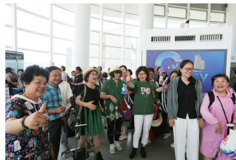
准备前往金边的南通旅客。记者尤炼

晚报讯 昨天12时,金边—南通KR915航班平稳降落在南通兴东国际机场,机场以水门礼迎接柬埔寨航空A320客机的到来。南通⇌金边航线正式开通,南通机场再添一条国际航线。