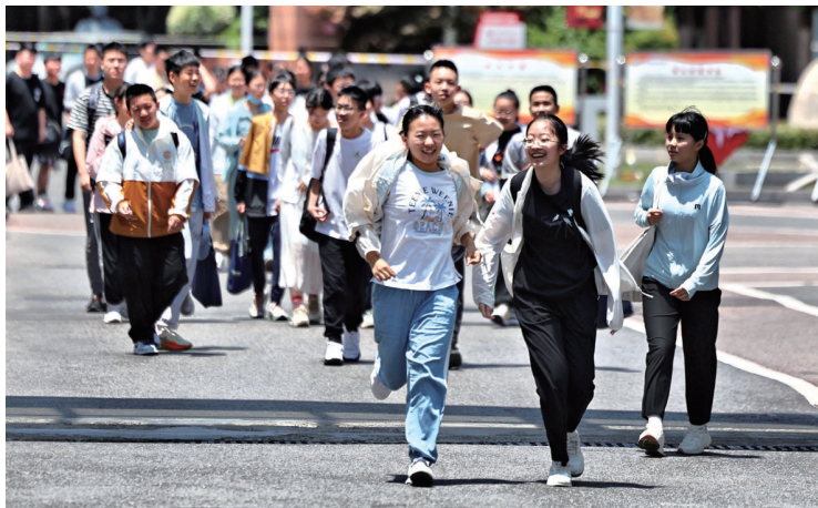
考生们陆续走出考点。记者徐培钦

晚报讯 昨天中午11时,随着一声铃响,2024年南通市初中毕业升学考试全部结束。我市数万考生完成了自己人生的一次大考,将走上新的人生阶段。