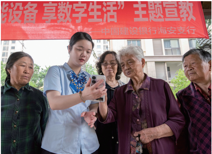
6月20日,建行海安支行营业部员工在海安开发区立发办事处东城社区一居民小区内,向老年居民开展“学智能设备 享数字生活”主题宣教。