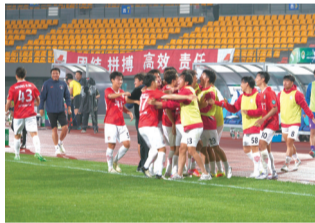
珂缔缘队员庆祝胜利。季耀

这场比赛对于双方都是“输不起”的“六分之战”。赛前,陕西联合、海门珂缔缘分列北区第一、第二,陕西联合仅仅因净胜球多而排名在前。此战之前,海门珂缔缘已经取得三连胜,状态正佳,一路紧追榜首。而陕西联合因为周末打了一场足协杯,舟车劳顿,客场出战状态存疑。“夏窗”开启后,海门珂缔缘迅速开展引援工作,3名“留洋”球员火速加盟球队。