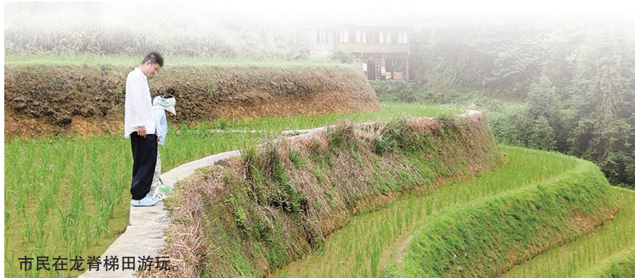
市民在龙脊梯田游玩。