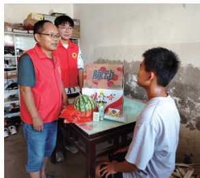
志愿者走访慰问困难家庭。刘畅

晚报讯 昨天，通州区平潮镇吉坝乡连爱心协会志愿者走访慰问了辖区5名困境妇女儿童家庭，给他们送去了防暑降温物品。据了解，自去年5月吉坝乡连爱心协会成立“吉坝乡连微关爱志愿服务队”以来，已经为辖区58名困境妇女儿童开展走访慰问、心理疏导、暖心陪伴、健康咨询等志愿服务活动1900余次。