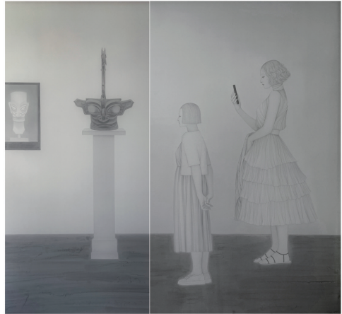
中国画《周末》作者杨宇