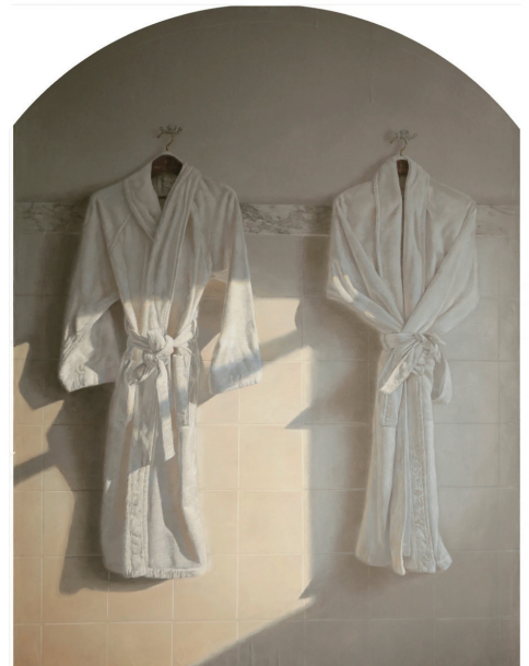
水彩粉画《有一点心动》作者冯卫军 孙瑾怡