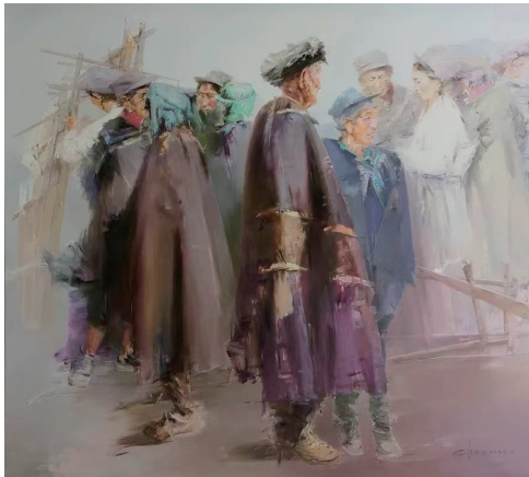
油画《桑梓地》作者陈彤