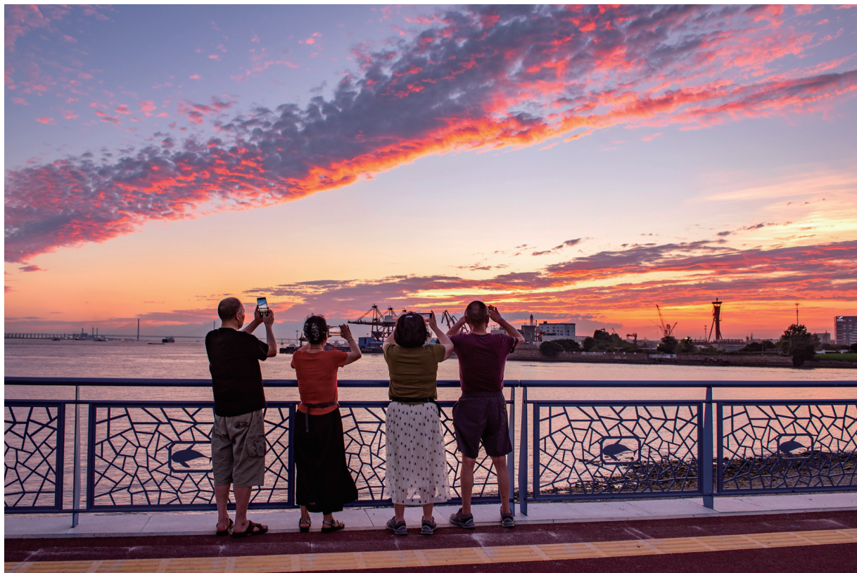
七月四日傍晚，晚霞似锦，通吕运河长江口景观带，人们拿出手机拍摄天空美景。 袁德君