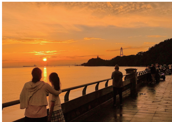
六月三十日傍晚，雨后放晴，市民来到滨江公园观看落日晚霞。 瞿德均