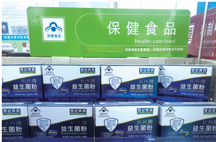
货架上的益生菌粉。

令记者咋舌的是,在线上的一些店铺,为日韩、欧美等国家和地区的进口益生菌产品价格十分烫手。其中,一款“褪黑素助深睡眠益生菌”,一盒售价达到4143元!