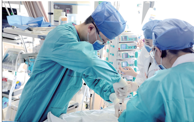
第三人民医院的医生为病人进行微创手术。