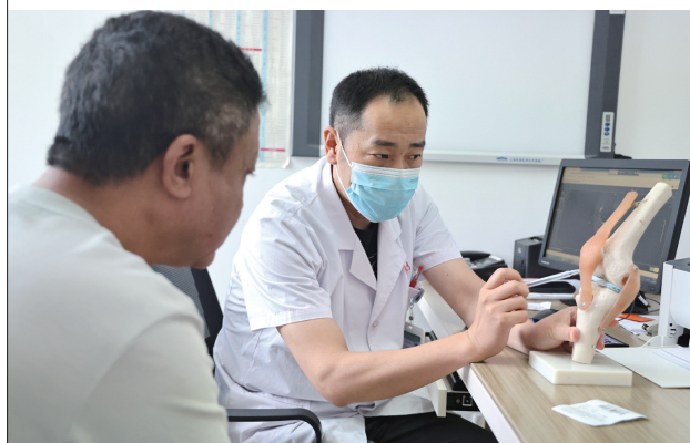
第三人民医院的医生为病人诊断病情。