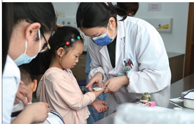
市中医院的医务工作者在为小朋友进行穴位敷贴治疗。