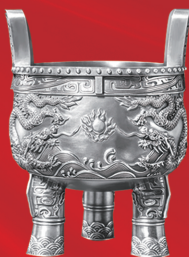
建行传世白银龙鼎