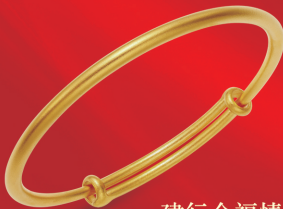
建行金福情双至手镯

克重: 50g、100g、200g、500g、1000g、2000g、5000g