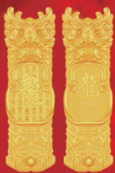
建行金金条迎福金条