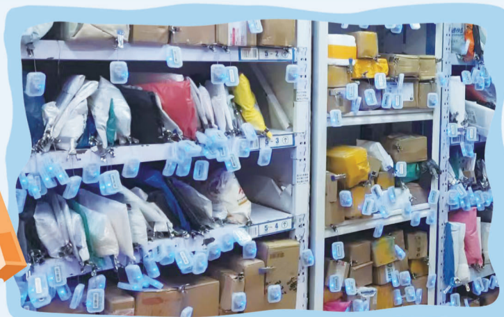
驿站的包裹挂上“智慧灯条”。周朝晖 张园