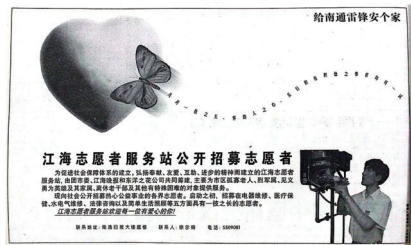
1998年3月23日,《江海晚报》刊登江海志愿者招募公告。