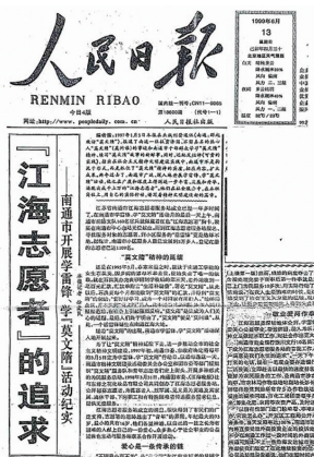
《人民日报》头版头条刊登报道。

通文明办〔1997〕2号 ★ 关于确定每年3月5日为南通市“学雷锋、学‘莫文隋’行动日”的请示 市文明委: 去年以来,我市选树的光辉榜样典型“莫文隋”在全市产生了巨大影响,《人民日报》等中央级主流媒体相继刊发了长篇报道,并多次刊登了评论文章,“莫文隋”已成为一面具有南通特色的精神文明建设的旗帜。为了进一步宣传和弘扬党的十四届六中全会精神,大力弘扬见贤思齐、扶危济困、助人为乐、见义勇为的“莫文隋”精神,将学习“莫文隋”的活动长期坚持下去,建议将每年的3月5日定为南通市“学雷锋、学‘莫文隋’行动日”,以后每年这一天,由市委和团市委等部门组织“莫文隋”服务队,青