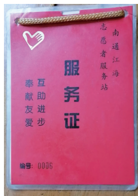
江海志愿者服务证