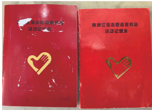
江海志愿者服务站活动记录本。

一九九七年,南通市精神文明办公室向市文明委提交的确定每年三月五日学雷锋、莫文隋行动日的请示。