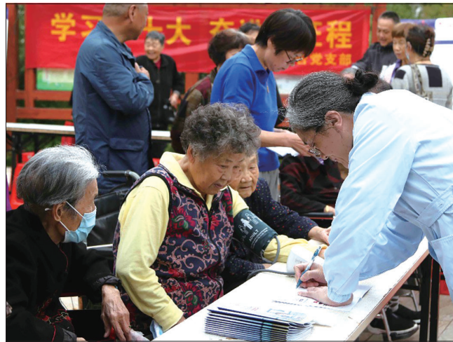
昨天,市一院和崇川区新城桥街道八厂社区联合主办的“世界血栓日”大型义诊举行,市一院10多名医护人员为社区居民开展健康咨询、科普宣传等服务。 冯启榕 张开云