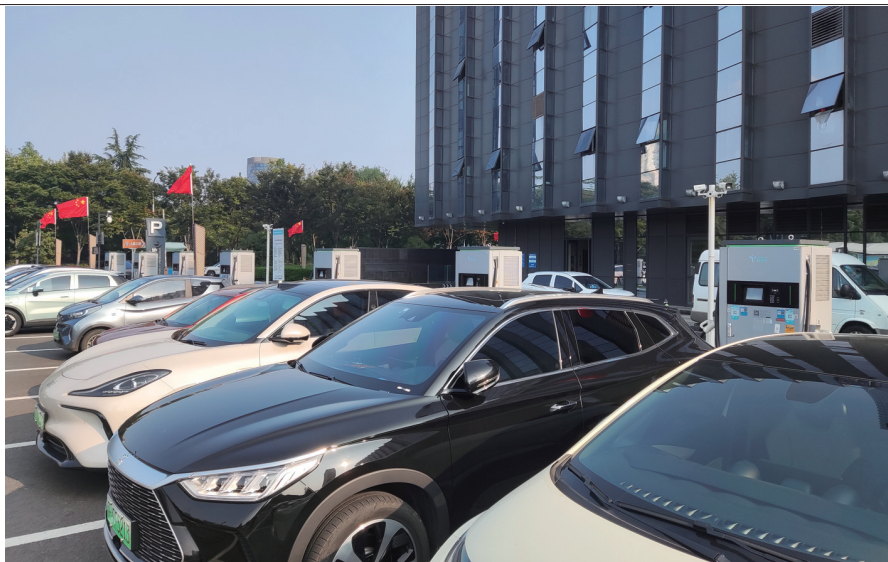
南通报业大厦充电点停放的车辆。

新能源汽车数量不断增长,充电桩相对紧缺。个别车主给车充满电后却不及时驾车离开充电桩车位。新的矛盾由此产生。对此,本报记者进行了深入采访。