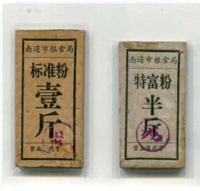
顾永祥收藏的粮油票、粮牌等。徐来