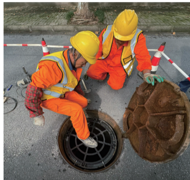
工作人员正在进行承重性测试。

从2020年开始，市排水管网公司就启动了防坠装置更换、加装工作，在实现濠河周边45平方公里主次干道及支路污水检查井防坠装置应装尽装的基础上，逐渐向主城区中心外围扩散。之前安装区域主要在