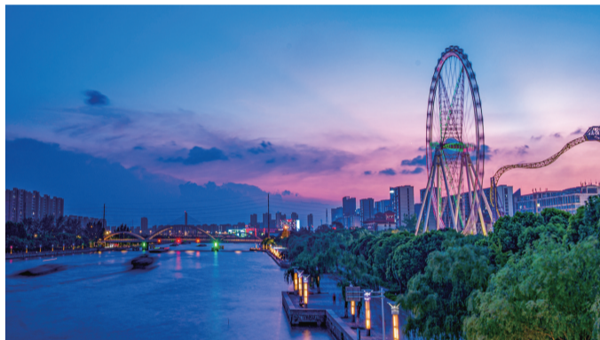
夜幕降临,通州大桥灯火璀璨,通吕运河河面船只穿梭,北岸摩天轮在微风中缓缓转动。