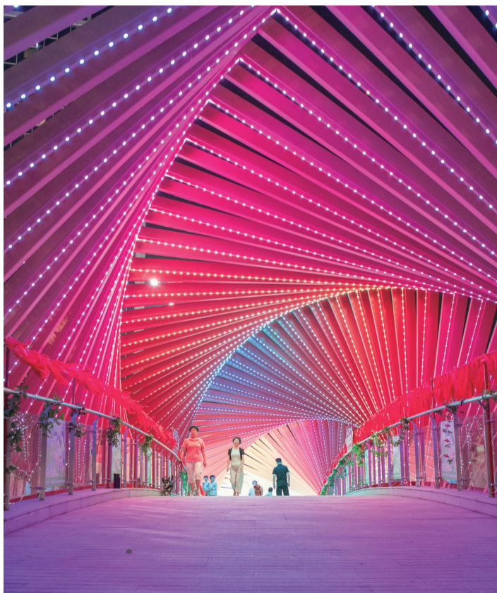
夜色里,南通龙信广场“彩虹桥”灯光熠熠。陈鲁明