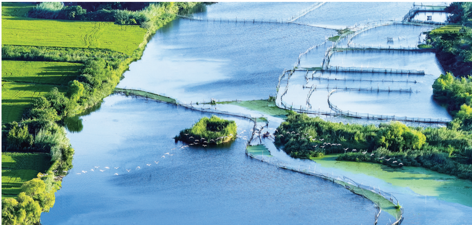
斜晖里,一行白色鹭鸟飞过通州进鲜港湿地大片水面。陆振峰