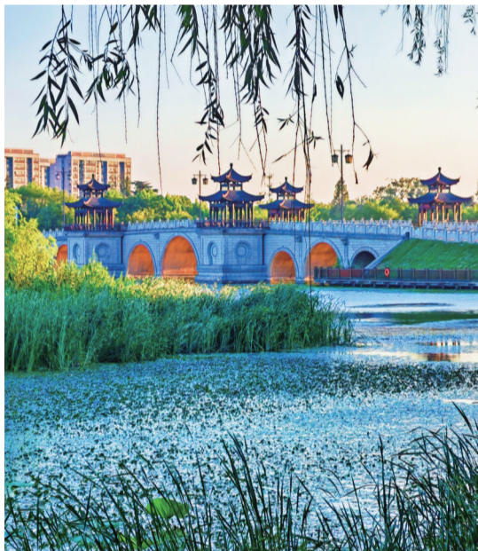
清晨,阳光照射在白龙湖公园爱莲桥桥洞的侧壁上,呈现出『金光穿洞』的美景。 李斌