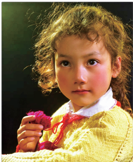
▲曹力军拍摄的《金色的童年》曾获江苏省人像摄影优秀奖。