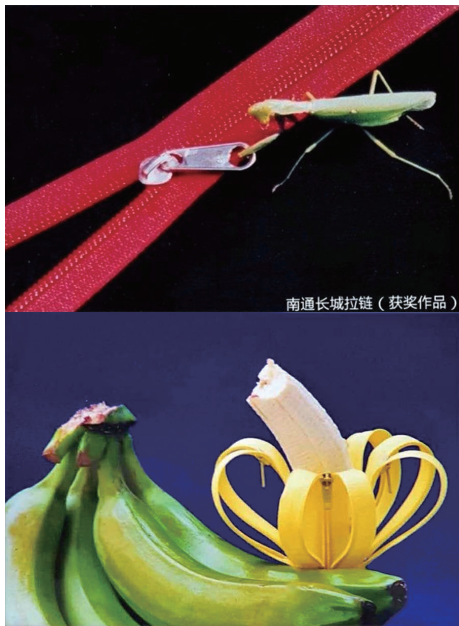
南通长城拉链 (获奖作品)