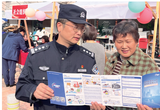
民警向居民宣传交通安全知识。

晚报讯 13日,崇川区学田街道千禧园社区联合崇川公安分局学田派出所开展“党建引领聚力 共建赋能谱新篇”法治宣传主题党日活动。