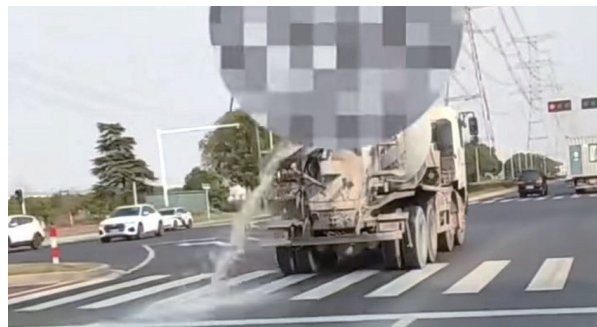
泄漏污水视频截图。

晚报讯 混凝土搅拌车误碰阀门开关,司机却浑然不知,导致车辆行驶过程中搅拌车罐内污水从东方大道沿路一直泄漏到海亚路口。4日,涉事搅拌车的所属运输公司因此被苏锡通园区综合行政执法大队依法处以3000元的行政处罚,同时缴纳由开发区环境卫生管理有限公司路面代清理费用1000元。