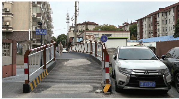
受损的小桥。