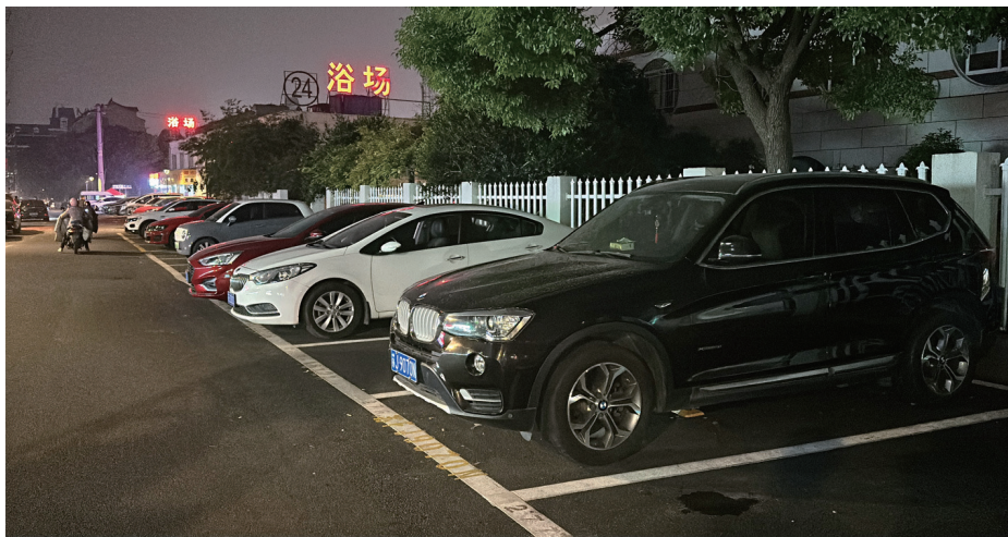
停车位均画有规整的停车线。记者张园

停车渐渐成为大家的“刚需”,小区停车收费问题广受关注。市区北濠桥东村为规范小区内停车而采取了一系列措施,未料引发个别业主的质疑,并向本报新闻热线反映情况。6日,本报记者赶到实地进行了专访。