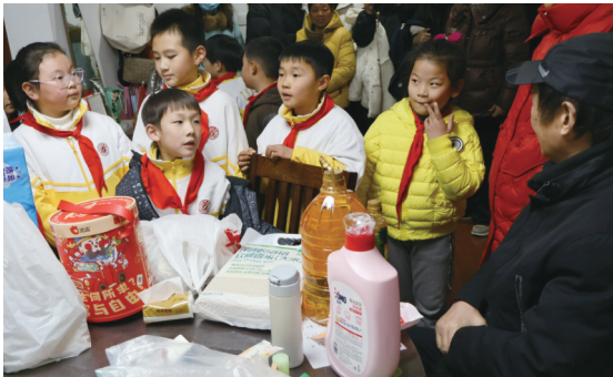
困难家庭。孩子们慰问

上周,《江海晚报》“关爱一线牵”刊出后,通师二附二(3)班第一时间联系栏目组,主动认领本期困难家庭微心愿。上月30日下午,通师二附二(3)班的师生代表,在崇川区城东街道东大街社区工作人员的陪同下,为本期困难家庭送去了微波炉、大米、食用油等爱心物资。