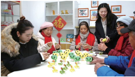
志愿者们制作『彩珠蛇』。