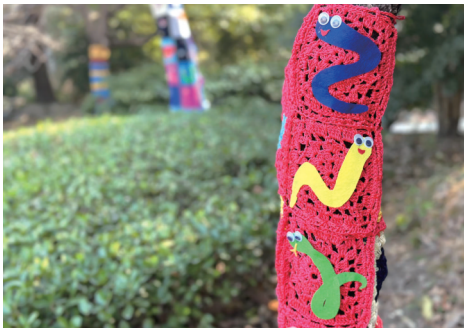
『织女』们钩制的毛衣『蛇』。