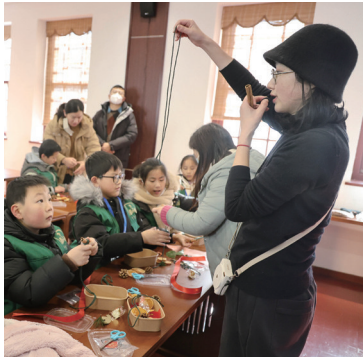
▲▲激发孩子们对大自然的浓厚兴趣。 记者徐培钦 实习生贾冯翔