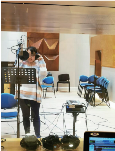
公益歌曲录制现场