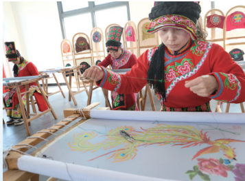
宁强县羌绣娘文化公司的绣娘正在赶制羌绣产品。