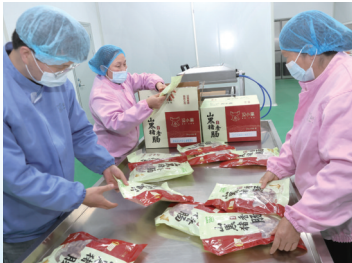
工人在佛坪县汉小黑(佛坪)食品有限公司车间忙碌。