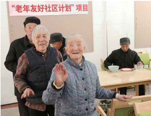
佛坪县东岳殿村“爸妈食堂”,用餐后的老人开心打招呼。

宁强县汉源街道街心公园,每天早上都会有附近居民在各种健身器材上锻炼。该县多个街心公园(广场)和小区安装了南通无偿捐赠的户外健身器材。