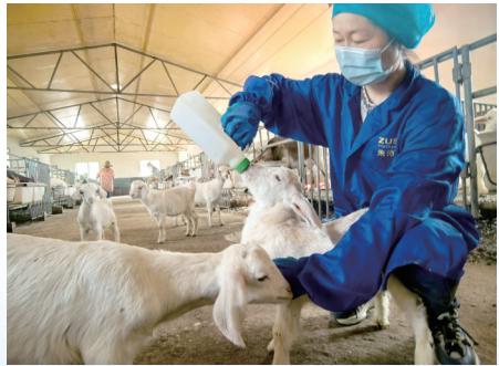
宁强县高寨子镇海门山羊养殖基地。