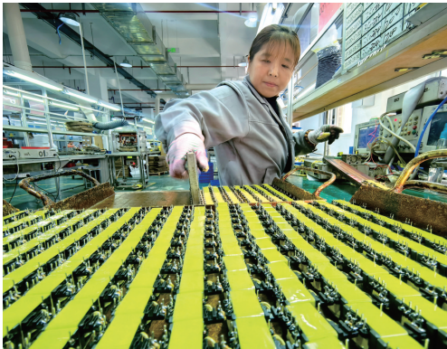
宁强县大安镇金牛社区易地搬迁安置点居民在“社区工厂”加工产品。