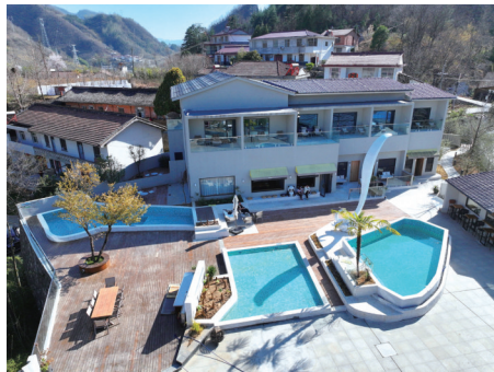
佛坪县袁家庄街道的民宿。