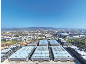
南通启东与汉中西乡县以循环经济园区为载体、国动产业园为平台,进行苏陕协作对接。