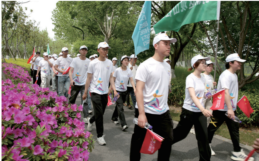
活动现场。

学校组织健步走活动,我们一个寝室的伙伴就都报名参加了。”南通科技职业学院大一的小张同学边走边说。“平时我们都是在学校里绕着操场夜跑,这是我们第一次沿着紫琅湖畔健步走,一点也不累,让人很舒服!”