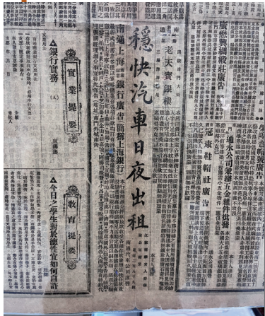
当时已有出租汽车广告。