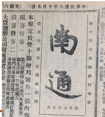
康有为题写的报头。

在张謇故里南通海门，近日发现了一批100多年前的地方报纸——《南通报》。中英文大开版，由国内名人定期题写报名，内容包罗万象而又专业、生动。值得一提的是，报纸上还有原收藏者题写的诗歌等手迹。该报由先贤张謇先生及其儿子张孝若创办，为我们了解百多年前南通及当时的国内外历史风云打开了一扇窗口，特别为当下研究张謇先生推动的“中国近代第一城”进程增添了真实可感的一手资料。