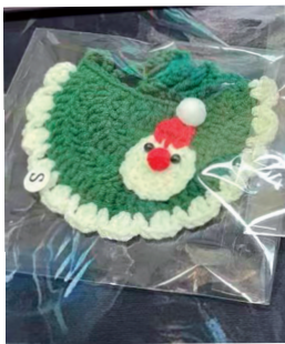
洪小姐制作的手工作品。