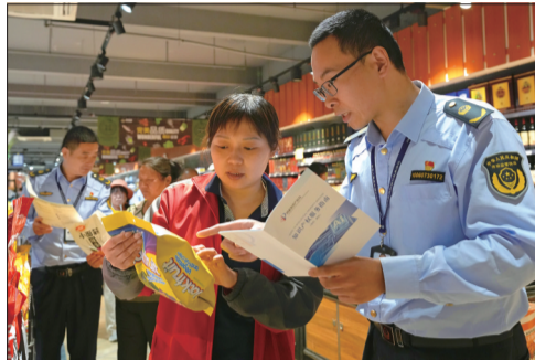
保护知识产权 净化市场环境

25日,执法人员向经营者及消费者讲解知识产权保护知识。当日,海安市市场监督管理局墩头分局开展知识产权保护专项检查,重点查验市场经营主体经销的智能玩具、食品等商品的专利标识和商标情况。 周强