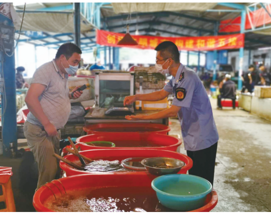
6日,通州区五接镇农贸市场内,关于打击非法经营长江水生生物的专项检查行动正在进行。通州市场监管局五接分局人员逐一检查水产品经营摊位有无“江鲜”身影。