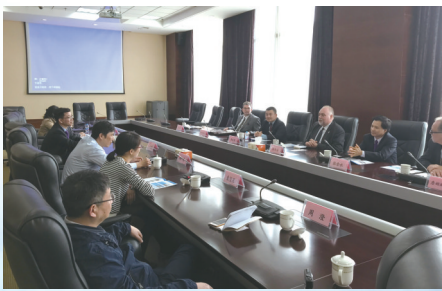
为项目提供精准服务

商局工作人员就主动找上门，提供全方位服务。“从开工许可证报批到员工宿舍申请，事无巨细，都给我们想到了。”作为“中