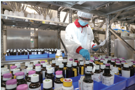
奇华顿食用香精香料(南通)有限公司生产一线