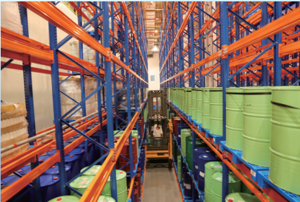
奇华顿食用香精香料(南通)有限公司