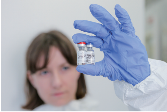
俄罗斯总统普京11日表示,俄卫生部已首次对本国研制的一款新冠疫苗给予国家注册,他的女儿已接种,并且感觉良好,希望在不久的将来开始大量生产。

全球新冠病例数仍在快速攀升。约翰斯·霍普金斯大学统计数据显示,全球累计确诊病例在美国东部时间6月28日超过1000万例,从1000万例升至2000万例仅耗时43天。