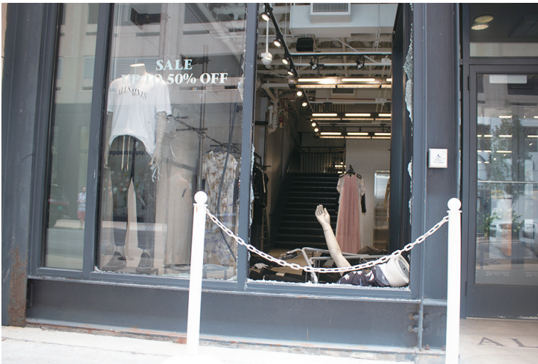
8月10日,在美国芝加哥市中心,一家服装店的橱窗被打碎。

芝加哥市长洛丽·莱特富特当天在新闻发布会上称暴力抢劫事件为“无耻的严重犯罪行为”,是对“城市的袭击”。她呼吁民众帮助辨认抢劫者。