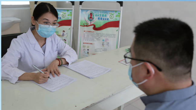
性病艾滋病防制科医师开展艾滋病自愿咨询检测(VCT)