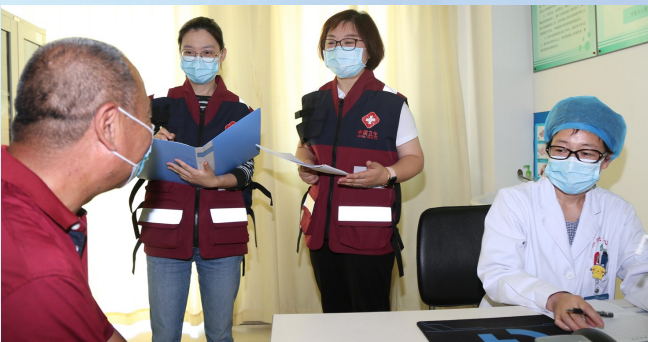
慢性传染病防制科医师对结核病患者进行现场访谈