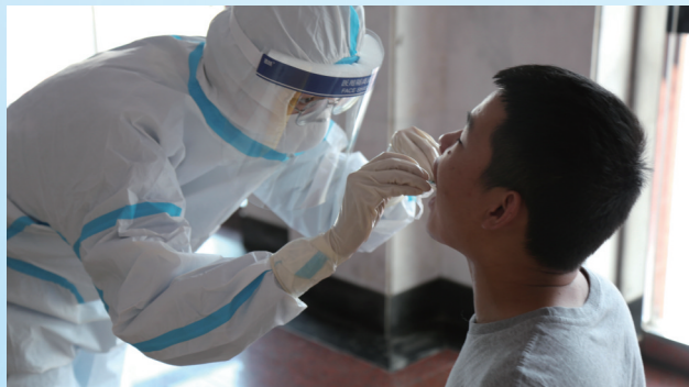
市疾控中心流调基地相关专业人员常态化值守,图为新冠检测咽拭子采样