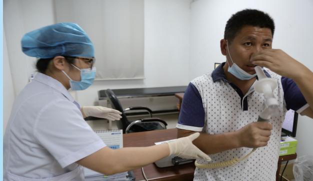
门诊部医师开展职业病健康体检,图为肺功能检测