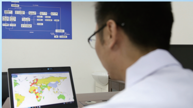
急性传染病防制科医师每日对新冠疫情进行风险研判