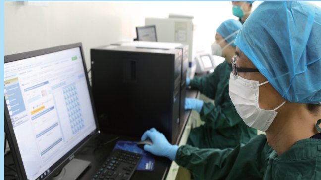
微生物检验科医师分析新冠病毒核酸扩增结果