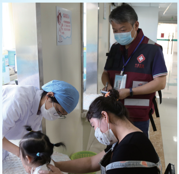
免疫预防科医师对儿童预防接种工作进行现场督导