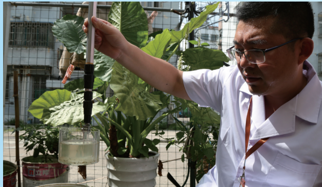
消毒和病媒生物防制科医师入户开展白纹伊蚊户内和户外专题调查