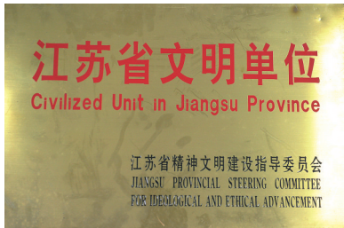
连续11届蝉联“江苏省文明单位”

唱好新时代的长江之歌,讲好长江大保护“故事”也必不可少。3年来,南通海事局开展百余次水上污染物清理活动,走进30余所学校,为15000余名师生普及水上安全知识,被命名为“南通市水上交通安全知识青少年教育基地”。