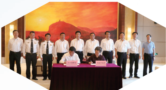
江苏海事局与南通市政府签署《加快大通州湾建设促进南通跨越发展合作备忘录》

“根据港区的特点并结合工作实际,南通海事将精神文明创建融入海事中心工作,通过文明创建极大地提升了水上交通安全监管服务水平。”沈道明说道。