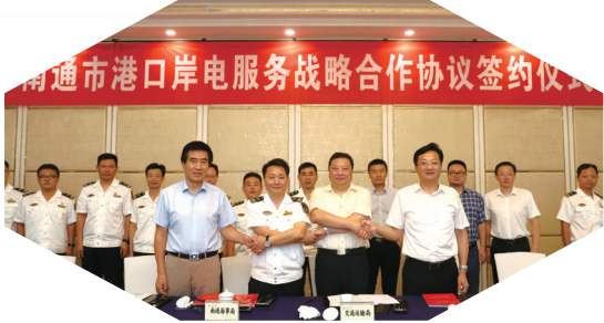
海事、交通、环保、国网联合签订港口岸电服务战略合作协议,推动航运经济绿色发展