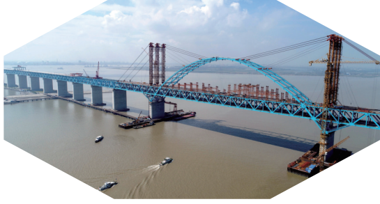
保障沪苏通大桥建设

建设工作,力争推动2022年1月1日起中国籍内河船舶和海船靠泊南通地区港口码头全面使用岸电目标。据统计,2019年南通海事局全面实施船舶大气排放控制区、船载危险货物安全综合治理回头看、船舶水污染防治等专项行动,开展燃油抽检932艘次,依法查处船舶大气防污染类、水污染防治类、载运危险货物谎报瞒报类违法行为483起,同比增长138%,防治油污力度不断加大。