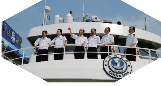
成功打造18人规模的“劳模群体”,被誉为精神文明“南通现象”