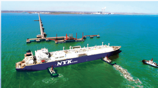
助力全球最大LNG船靠港,服务“大通州湾”发展