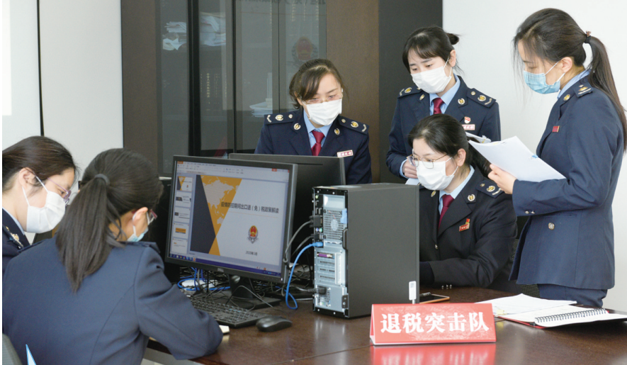
南通市税务局组建退税突击队,加快出口退税审批速度。

新冠肺炎疫情发生后,南通市税务局积极发挥职能作用,精准落实税费支持政策,持续优化税收营商环境,“硬核举措”贴心服务,为中小微企业、外贸企业、餐饮业等受疫情影响较重的群体送去温暖。