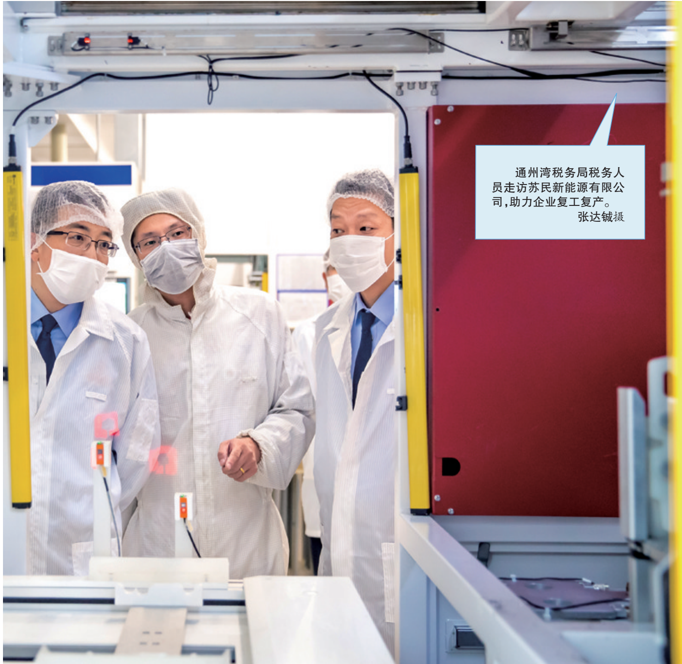
通州税务局税务人员走访苏民新能源有限公司,助力企业复工复产。

今年以来,为应对新冠肺炎疫情对经济社会发展造成的冲击,国家出台一系列针对性强、含金量高的税收优惠政策,支持疫情防控和企业复工复产。南通市税务局积极发挥职能作用,从落实税收政策、做好产业分析、加强纳税服务等方面多点发力,助力优化营商环境,积极服务市场主体,充分展现了新形势下的税务担当,用实际行动书写服务“六稳”“六保”新答卷。