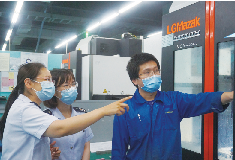
南通开发区税务人员在精捷电子有限公司听取生产流程介绍,宣讲税收优惠政策。