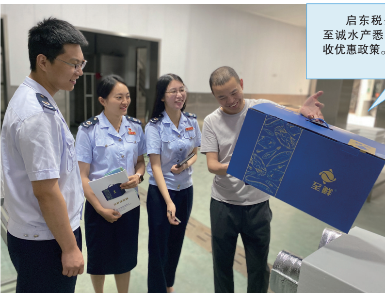
启东税务干部在至诚水产悉心辅导税收优惠政策。

微信群等方式,及时分类推送政策;对疫情期间符合税费减免享受条件的企业,精准辅导纳税申报,确保政策红利应享尽享、应享快享。