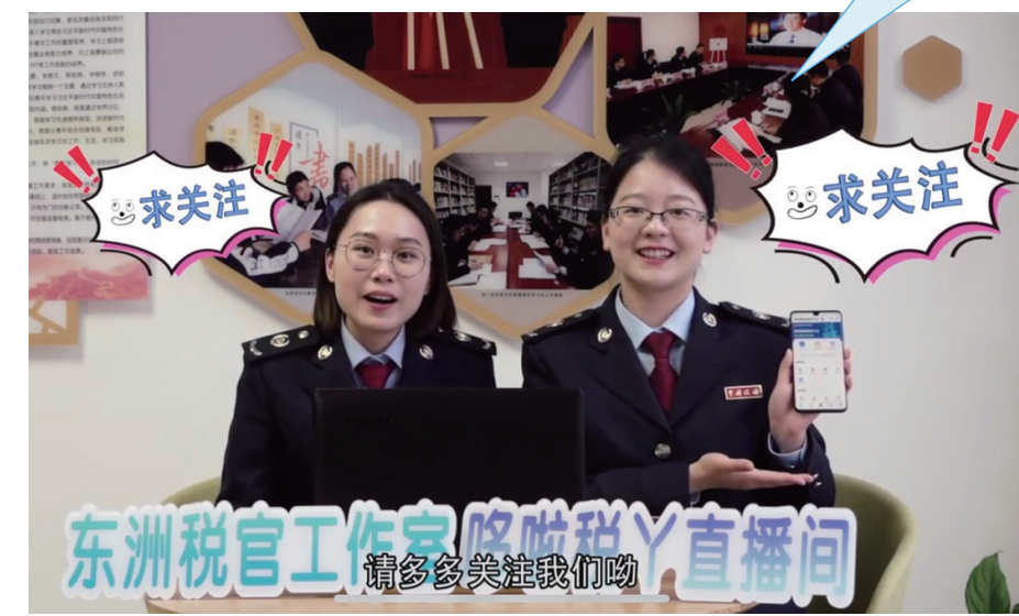
海门税务“哆啦A梦直播”正式上线,为纳税人提供线上培训辅导。

“哆啦A梦直播”正式上线,海门税务专门为纳税人线上培训辅导开辟新途径,生动有趣,方便快捷。