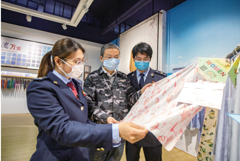
海安市税务局不断优化“非接触式”办税服务,全力推出出口退税网上申报“即报即审、即批即退”,助力企业复工复产。图为税务人员在江苏联发纺织股份有限公司展销厅调研。